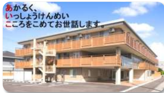
特別養護老人ホーム ゆうけあ相河

1人ひとりの個性や生活リズムを尊重し、今までの暮らしが継続できるようサポートします。個室とフロアとを行き来し、ご自分のペースで過ごしていただけます。