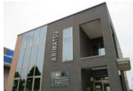
当院別館（本館左側の建物）